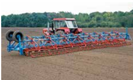
1975: GAROMAT mit Doppelkrümlern und 12 m Arbeitsbreite – damals die breiteste Saatbettkombination Europas!