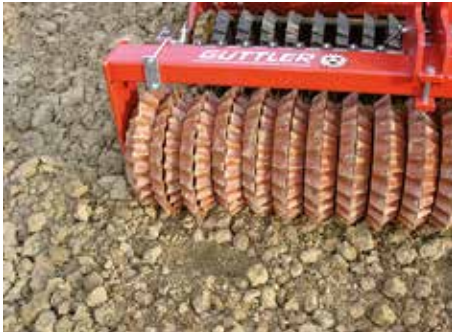
1984 kam die schwere selbstreinigende Prismenwalze® mit Durchmesser 45/50 cm auf den Markt.

1981 wurde die heutige Güttler GmbH gegründet. Das Programm bestand damals nur aus den Garomat Saatbettkombinationen mit selbstreinigender Prismenwalze® 32/35 cm, bis 6 Meter! Als Ergänzung vertrieben wir bis 1984 Kreiseleggen und Maishäcksler der Firma Feraboli, Italien. Ab 1984 wurden in stetiger Arbeit die heute bekannten Bauformen der Prismenwalze® entwickelt.