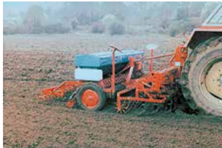
1973: GAREG 3 m mit Drillmaschine kombiniert