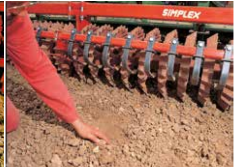
1987: Die Simplex Prismenwalze® wurde entwickelt. Mittlerweile sind mehr als 10.000 Walzen dieses Typs in Einsatz.