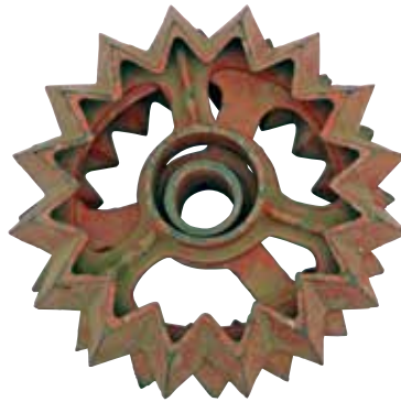
Die erste patentierte Güttler-Walze mit \varnothing 32/35 cm

1976: Fritz Güttler kam zu der Überzeugung, dass die gewandelte Wirtschaftsweise und die ständig größeren und schwereren Schlepper die wirklich flache Bearbeitung nicht mehr zulassen.