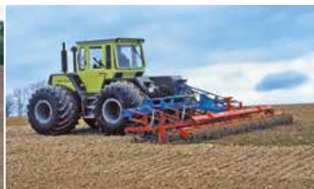
Ab 1977: Die leicht gebaute GAREG wurde vom GAROMAT abgelöst, der den wachsenden Schlepperleistungen Rechnung trug und seiner Zeit weit voraus war.