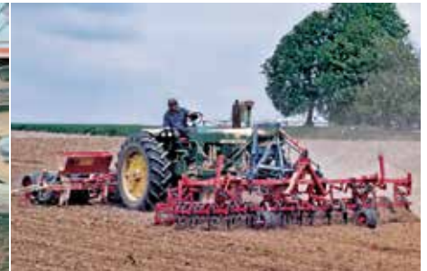
1976: GAREG 5 m in Front (Schmotzer Multilift)