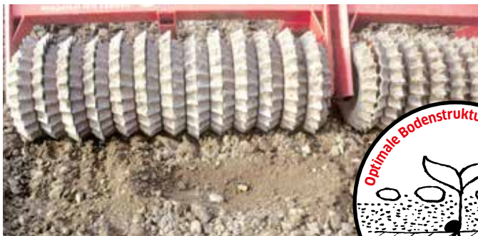
Ein ideales Saatbett: Unten fest – oben locker Feinerde unten, Grobkrümel oben Unübertroffene Selbstreinigung

Trotz vieler Rückschläge ließ er sich nicht entmutigen und entwickelte mit der patentierten Prismenwalze® einen ganz neuen, revolutionären Walzentyp. Er wurde damit ein Pionier der Rückfestigung. Anfänglich stieß er oft auf Unverständnis, heute ist „Rückfestigung“ jedoch längst selbstverständlich geworden.