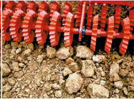
1985: Die Duplex war die Neuheit von Güttler auf der ersten Agritechnica in Frankfurt/Main. Anfänglich hatte die Duplex unterschiedliche Walzenstern-Durchmesser vorne und hinten.